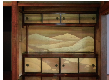
梅戸在貞と思われる壁貼付絵

かつての記憶をとどめるために、「芦辺屋・朝日屋跡と鏡山」は2008(平成20)年6月に県の名勝・史跡に指定されています。